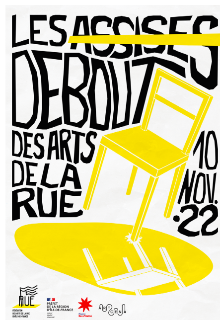
Affiche de la première édition en 2022

Les Assises debout prennent la forme d'une journée professionnelle pour la structuration du secteur sur le territoire francilien. Elles ont pour ambition de construire un carnet de route et des objectifs pérennes. Au-delà de pointer les manques et les besoins des un·es et des autres, elles sont surtout l'occasion de mettre des idées en commun, de construire de nouvelles préconisations pour les arts de la rue et d'alimenter celles qui existent déjà.