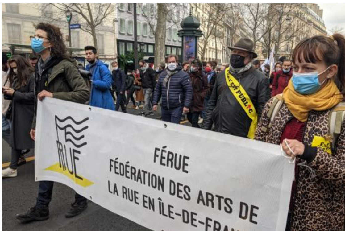
La FéRue à la manifestation du 4 mars 2021

Tout au long de l'année, la FéRue a été présente dans les mobilisations pour demander, aux côtés de nombreuses organisations et individus, la prolongation de l'année blanche, la mise en place de plans de soutien à l'emploi, des moyens pour garantir les droits sociaux, l'accès aux congés maternité, aux congés maladie indemnisés, ou encore le retrait de la réforme de l'assurance-chômage.