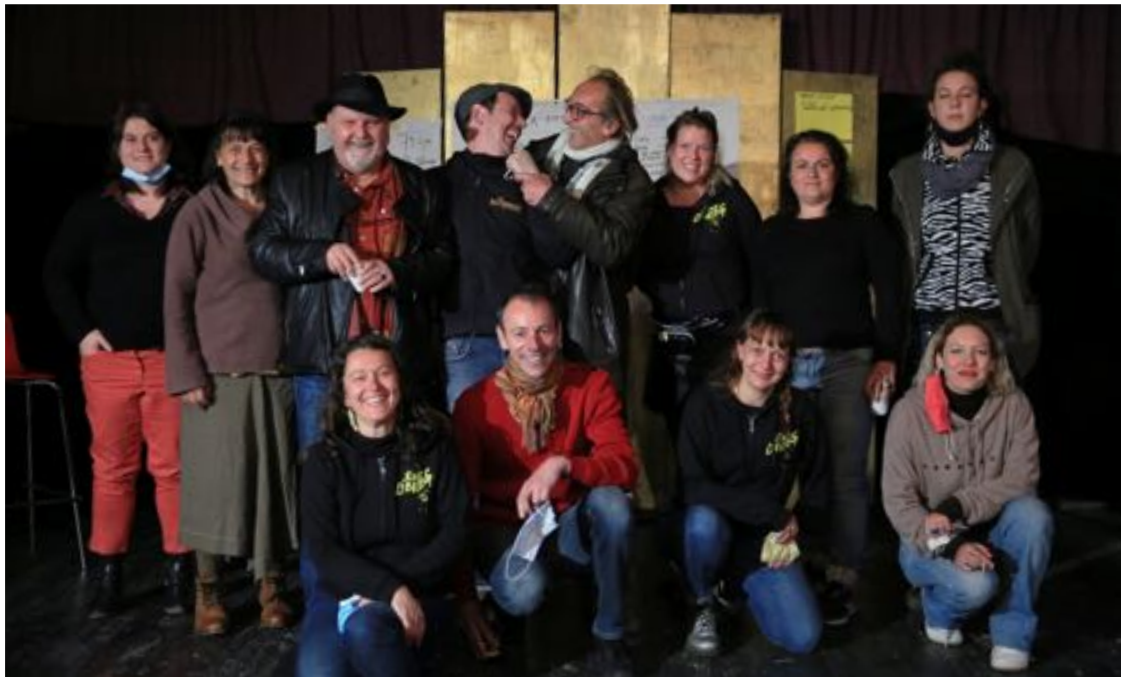
Le CA élu à l'AG de 2021

Le CA se réunit en présence de la coordinatrice du réseau qui propose l'ordre du jour et rédige le compte-rendu de la séance, accessible à l'ensemble des adhérent-es.