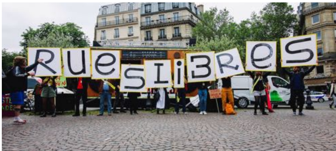
Rues Libres du 5 juin 2021

En 2021, l'enquête sur les compagnies franciliennes (2018) a été achevée par la FéRue et est disponible en ligne 5 . Si la FéRue n'a pas initié de nouvelle enquête cette année, elle encourage activement ses membres à répondre à celles qui sont portées par la Fédération Nationale des Arts de la Rue. Une enquête sur les compagnies nationales (chiffres 2019) a été publiée au cours de l'été 2021 6 , et une nouvelle enquête sur les chiffres 2020 est en cours.