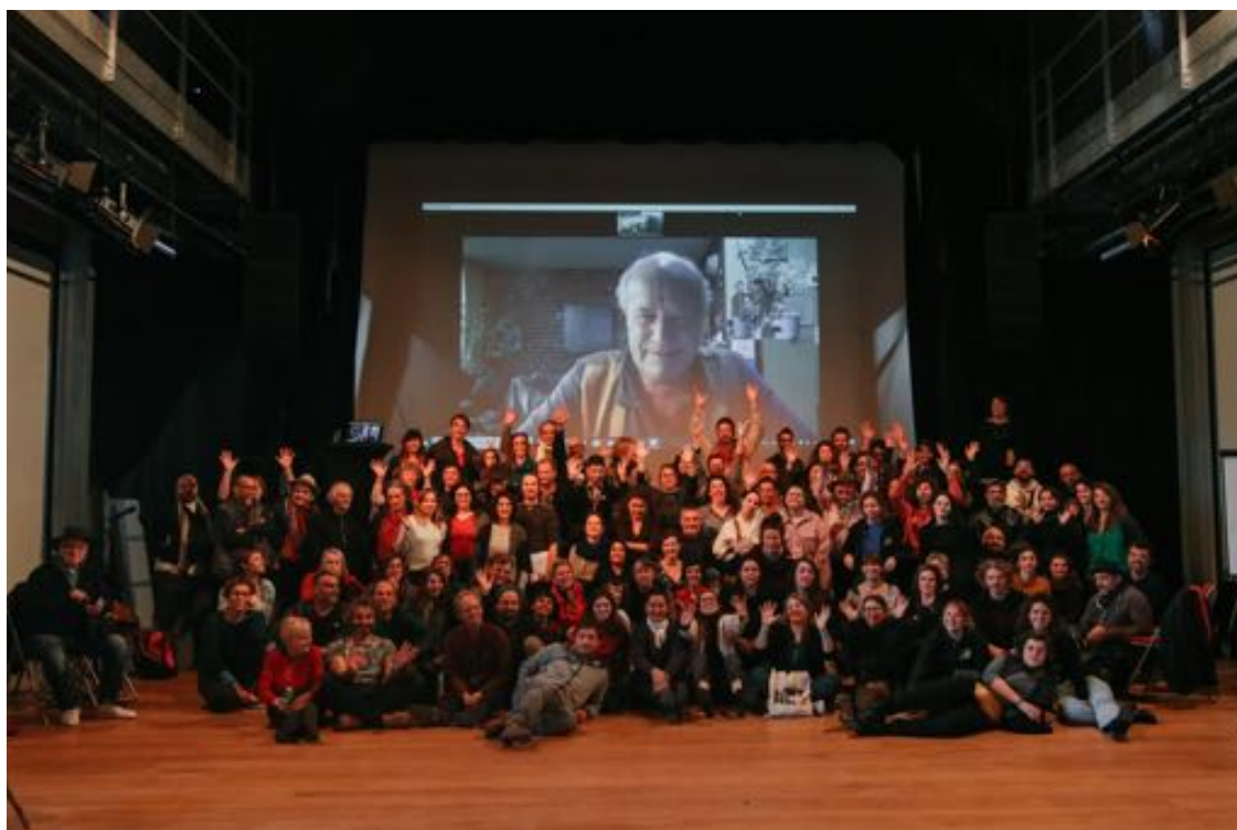
11 ème Université Buissonnière des Arts de la rue - Novembre 2021