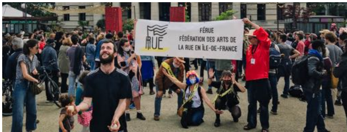
Rues Libres du 5 juin © FÉRue