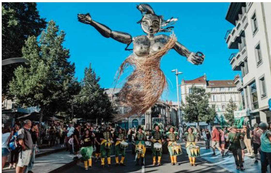
La Grande Manifestive - 18 août 2021

Les autres sources de financement de la FéRue sont constituées des ventes de goodies et des adhésions.