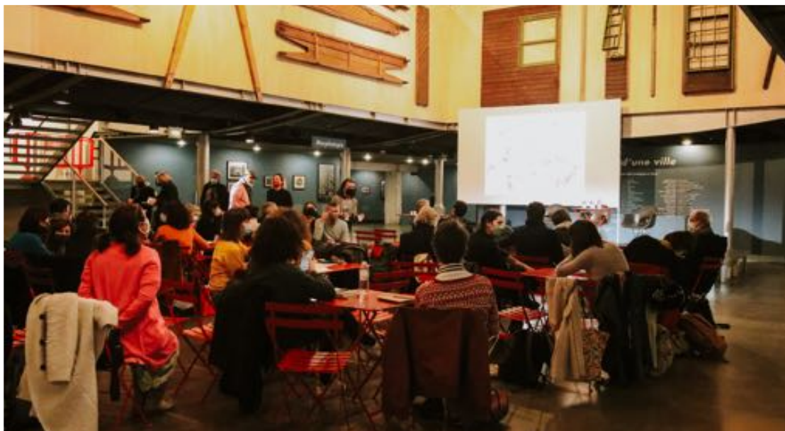
Événement au Pavillon de l'Arsenal - 1% Travaux Publics

Perspectives : organisation d'un nouveau labo autour du 1% Travaux Publics à l'horizon 2023 et publication d'un deuxième livre blanc par la Fédération Nationale des Arts de la Rue.