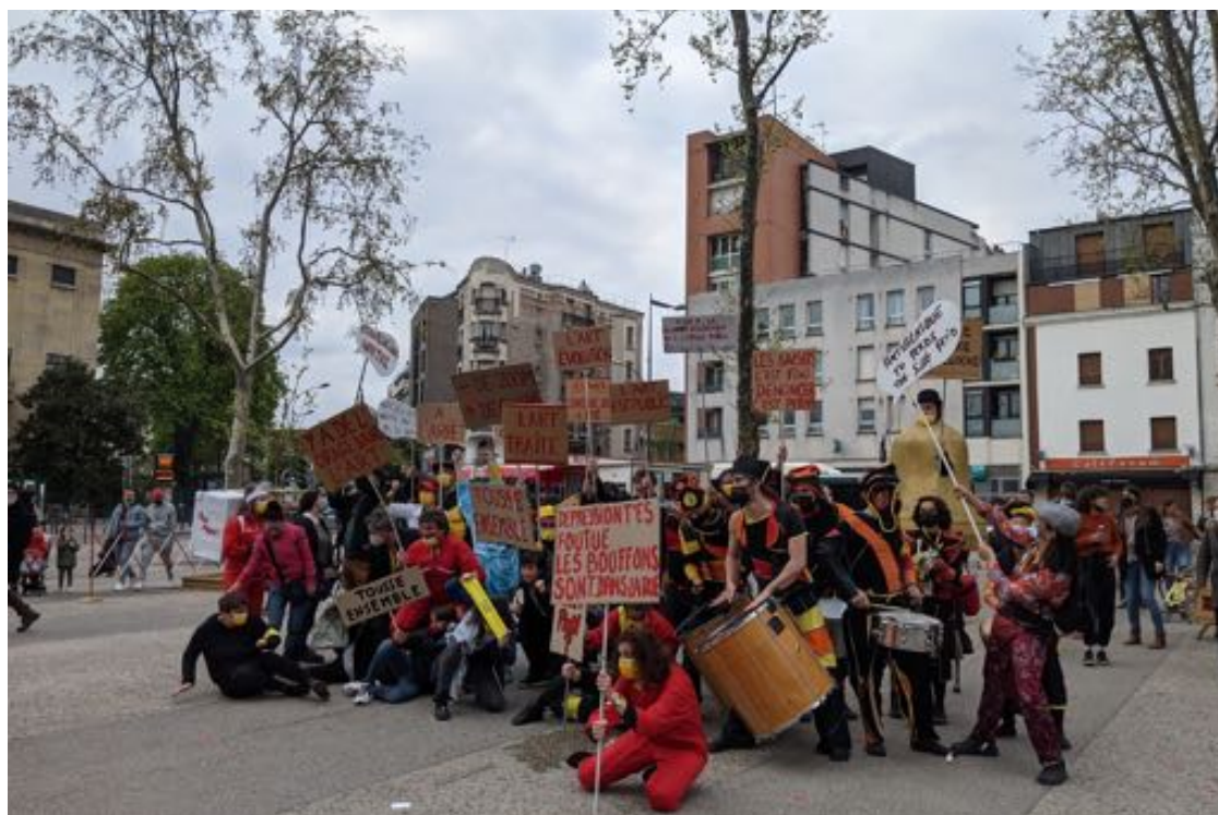
Place Libre le 13 avril 2021