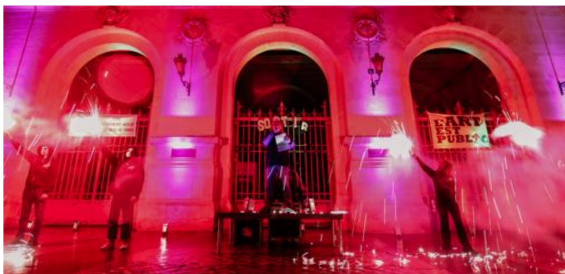
S.O.R.T.I.R avec les arts de la rue, le 2 octobre 2021